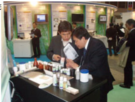
本公司同仁向日本客人介紹產品情形