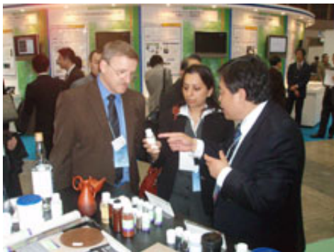
伊朗客人至本公司攤位參訪情形