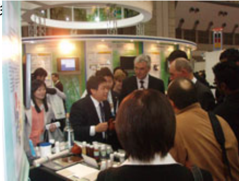
加拿大客人至本公司攤位參訪情形