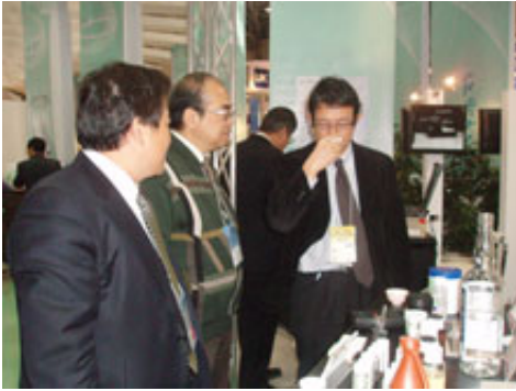
中央研究院物理所吳所長與日本記者參訪本公司攤位情形