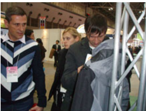
俄羅斯客人了解本公司應用產品之情形