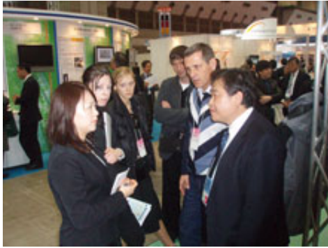
俄羅斯客人參訪本公司攤位情形