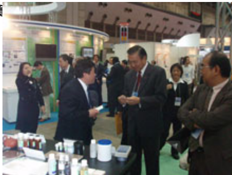
駐日馮大使來訪本公司之情形