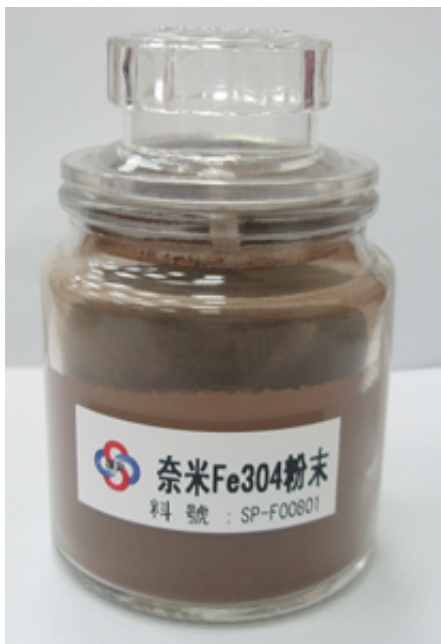
奈米四氧化三鐵粉末

四氧化三鐵是鐵的一種氧化物，其化學式為 Fe_3O_4 。四氧化三鐵是唯一可以被磁化的含鐵化合物，也被稱為磁鐵礦，外表呈鐵褐色，具有天然軟磁性。四氧化三鐵是鐵生成之前由相近於鐵礦石所組成，也就是說鐵存在於氧化還原的狀態。北京故宮的牆上呈紅色，係因含有四氧化三鐵成份而聞名。另外，四氧化三鐵 可自行形成磁場，據命理老師推薦有招財增福的作用，值得大家一試。